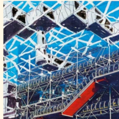
Yona Friedman, Extensions to the Georges Pompidou Center, Paris, 2008 (détail)

Cet article permet de soulever les questionnements suivants :