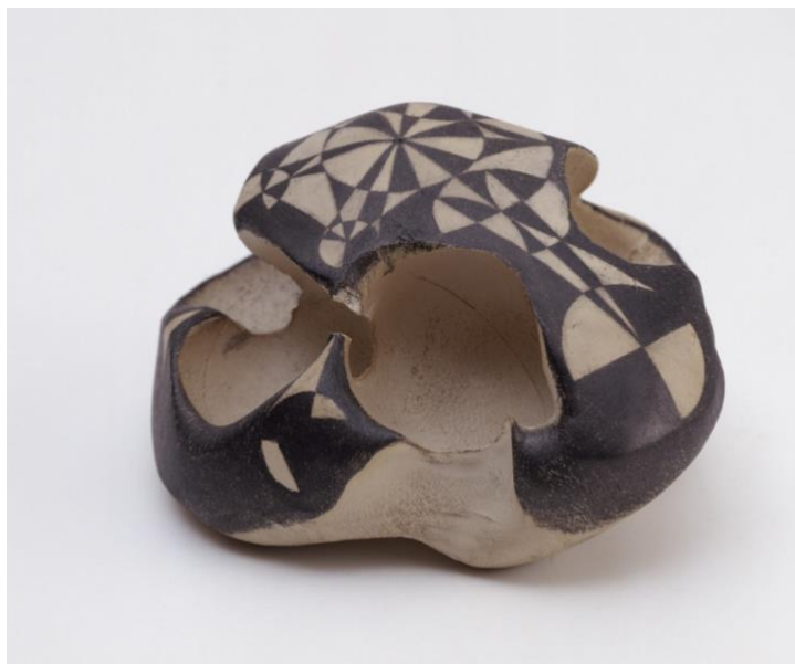
Gabriel OROZCO hand pressing five balls into a mass, after a drawing , 2002, dessin au crayon sur motte de terre pressée