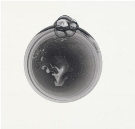
Roland FLEXNER , Sans titre , 2000, encre de Chine et savon sur papier couché, 17,1x13,8cm FRAC Picardie