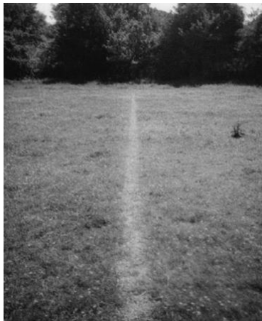
Richard LONG A line made by walking , 1967, performance photographiée