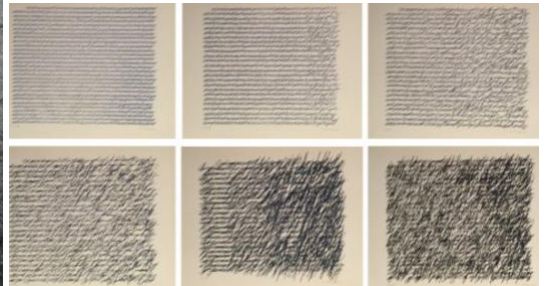
Vera MOLNAR Lettres à ma mère VI , 1990, encre sur papier FRAC Picardie