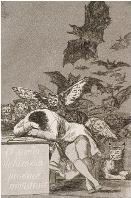
Francisco DE GOYA (1746-1828) Le sommeil de la raison engendre des monstres 1799 Eau-forte et aquatinte (21,6 x 15,2 cm). BnF, département des estampes et de la photographie