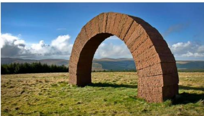
Andy GOLDSWORTHY, Striding Arch, Colt hill, 2018

Un exemple d'une démarche prenant la nature comme matériau pour dessiner et d'une démarche interrogeant le processus de création (frottage) pour dessiner.