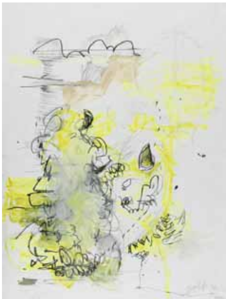
chantalpetit, Sans titre , 1997