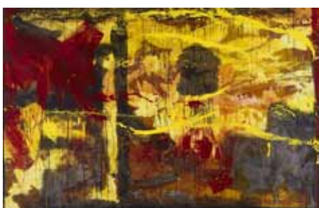
Jean-Paul Huftier, Comment y aller , 1983.

rencontre découverte de l'exposition pour les responsables de groupes constitués → jeudi 17 novembre 2016