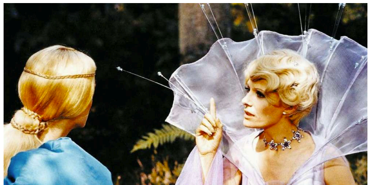
Jacques DEMY, Peau d'âne , 1970. Film en couleur, 89 minutes