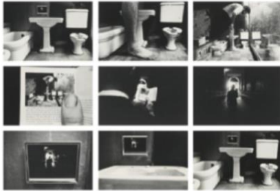
Duane MICHALS, Things are queer , 1972, photographies gélatine d'argent

En 1985, Daniel Buren est l'invité du festival d'Ushimado au Japon. Il est frappé par le site exceptionnel, ses nombreuses îles, son relief accidenté, contrastant avec l'impressionnante jetée du XVIIe siècle, parfaitement rectiligne et de 400 mètres de long, qui se déploie dans le port. Il propose alors deux travaux en corrélation : sur la jetée sont disposés, face à la mer, deux-cents drapeaux de dix couleurs différentes, réunis par groupes de vingt et installés suivant l'ordre des couleurs de l'arc-en-ciel. Sur les collines environnantes sont positionnés cinq panneaux carrés de trois mètres de côté chacun, découpés par une forme géométrique simple (cercle, losange, carré, triangle), et recouverts de l'outil visuel. Ces panneaux encadrent les drapeaux situés en contrebas et proposent des points de vue. Le paysage environnant est également « encadré », ce que les japonais traduisent par : « emprunter le paysage » (Sha-kkei). http://2012.monumenta.com/fr/sha-kkei-ou-emprunter-le-paysage