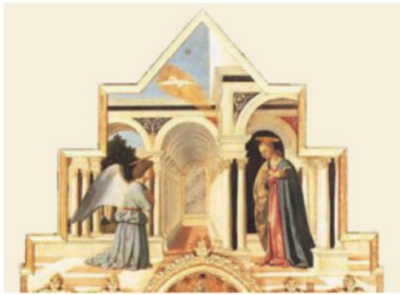
L'annonciation (couronnement du Polyptique de saint Antoine) Piero della Francesca, 1470 Huile et tempera sur panneau, 122 x 194 Galleria Nazionale dell'Umbria, Pérouse

Photo-souvenir : Sha-Kkei ou Emprunter le paysage , travail in situ , Ushimado, Japon, novembre 1985.