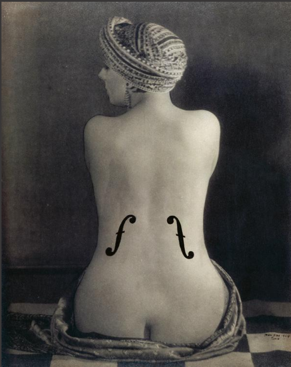
MAN RAY, Le violon d'Ingres , 1924, photographie, Épreuve aux sels d'argent rehaussée à la mine de plomb et à l'encre de Chine et contrecollée sur papier, 28,2 × 22,5 cm, Musée National d'Arts Moderne, Paris.

Violon d'Ingres est une photographie érotique qui cite une icône de la peinture française : La Baigneuse dite de Valpinçon , peinte par Dominique Ingres et conservée au Louvre. Elle nous montre Kiki de Montparnasse, alors la maîtresse de Man Ray, avec ses bras croisés si loin devant elle que son dos ressemble à la table d'un violon. Cette association est encore accentuée par les deux ouïes qui ont été rajoutées après coup à l'aide d'un pochoir. Cette photographie qui a été publiée en 1924 dans la revue Littérature était parmi les premières images qui ont apportées la preuve que le procédé photographique, apparemment lié pour toujours au réalisme, était suffisamment souple pour réaliser des images surréalistes.