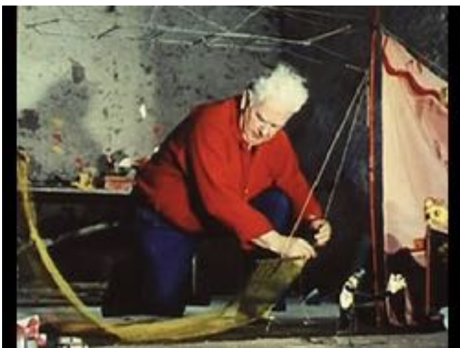
Calder, le cirque , 1927 (filmé en 1955)

j'écris ce qui me paraît important de retenir sur cette œuvre.