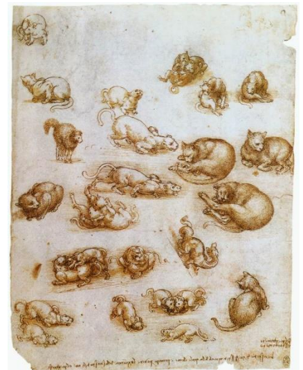
Léonard de Vinci (1452-1519) Étude du mouvement des chats dessin à la plume et à l'encre, lavis de craie blanche, 27 x 21cm. Windsor, Château de Windsor, Royal collection.