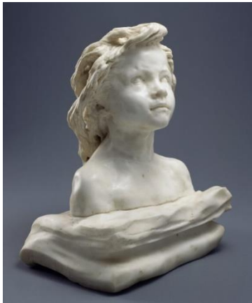
Camille CLAUDEL (1864-1943) La Petite Châtelaine 1895-1896, marbre, H. : 44,2 cm ; L. : 36 cm ; P. : 29 cm. Roubaix, Musée d'art et d'industrie André Diligent, La Piscine.