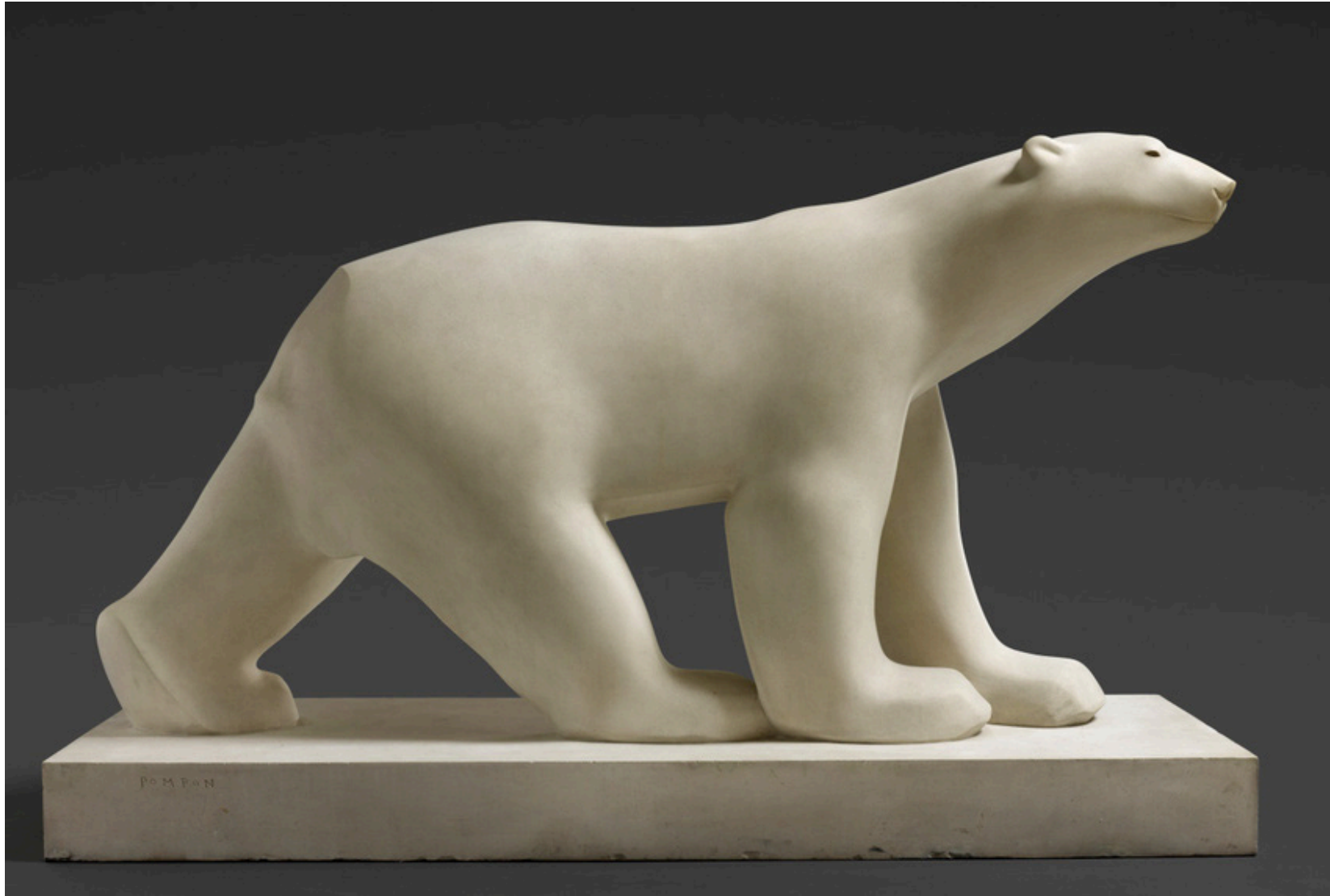
François POMPON, Ours blanc , entre 1923 et 1933, statue en pierre, H : 163 cm x L : 251 cm x l : 90 cm. Musée d'Orsay, Paris, France.