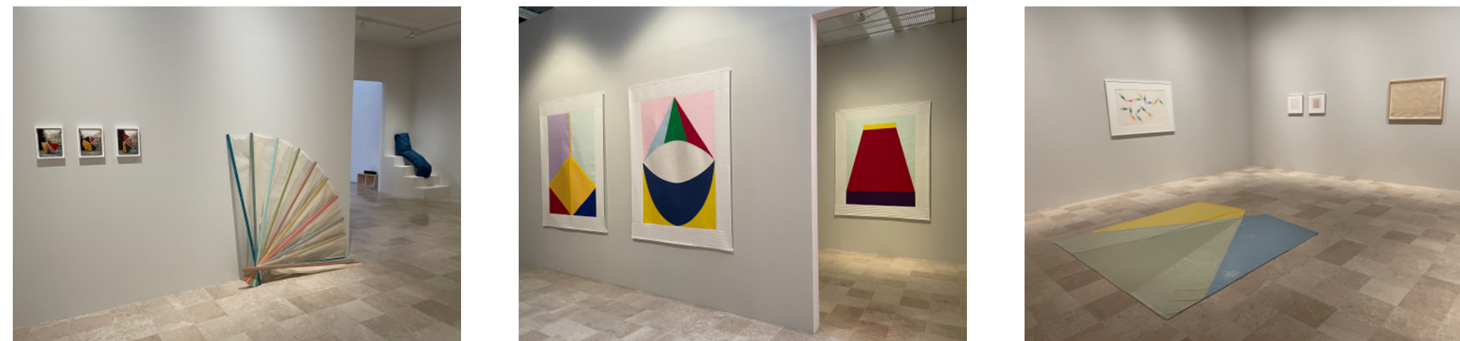
Aperçu de l'exposition Transmeare au Frac Picardie

Présentation de l'exposition sur le site du Frac picardie